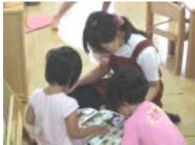
お姉ちゃん読んで！保育園での一コマ

毎年恒例の、夏のボランティア体験。今年は73箇所の施設・団体の方々に活動の場を提供していただき、中学生から社会人までの104名が体験を行いました。参加者の感想文による活動報告文集「わたしたちの夏」を今月中旬に発行します。今回参加できなかった方も、活動した方の体験談を参考に、はじめの一步をふみだしてみませんか？