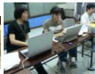
夏ボラ2008体験メニュー「要約筆記」より