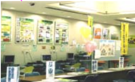
昨年のパーティー会場の様子

フォーラムの詳細は、たま広報1月20日号に掲載予定です。ボラセン企画の詳細は、次号にてお知らせします。