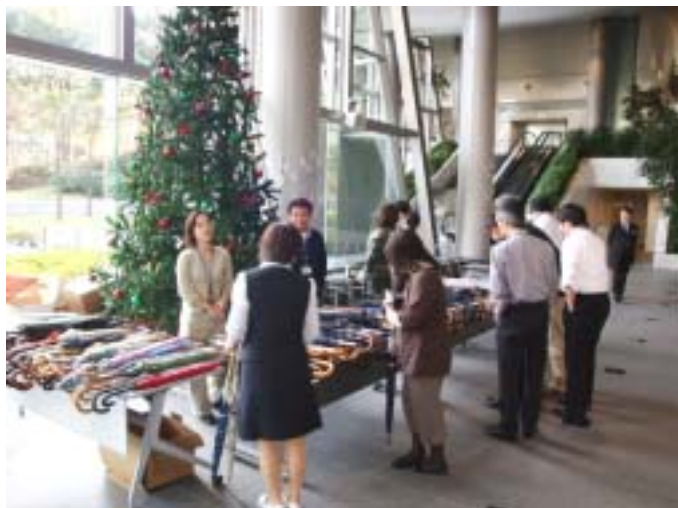
チャリティーバザー(不要傘の販売)