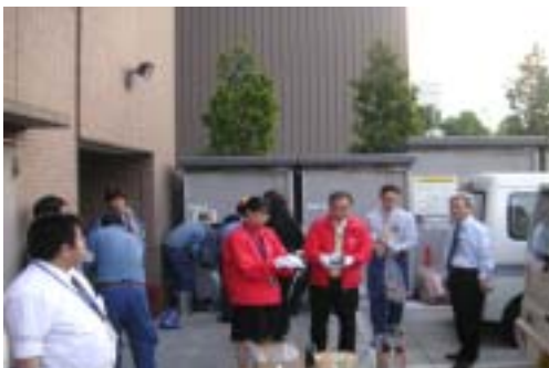
クリーン作戦開始

規制緩和の一環として電力の小売り自由化は、平成12年3月から一部導入がされた以降、電力産業においても競争原理が働く市場となり、「電気料金の引き下げ」や「お客さまサービスの向上」が求められ、地域の皆さまから「信頼される」「親しまれる」「選ばれる」企業となるため、働く仲間(労働組合)が中心となり、「地域貢献ボランティア」について話し合いをしたところ、「クリーン作戦」をやろう!ということになりました。この取組みは平成13年9月から現在に至るまで、八王子支社が一丸となり毎月欠かさず実施しています。