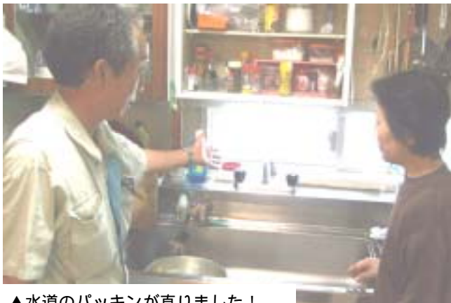
▲水道のパッキンが直りました！

また、住宅デーの事前活動として実施している「小修理活動」は、福祉世帯等に向けた取組みで、建設職人が技術を活かし、住宅の修繕や修理など小さな工事をボランティアで行っています。依頼内容は、水道のパッキン交換・網戸の張替え・ガラスの交換・雨どいの修理、中には物置の解体などもあります。この取組みは依頼が多く、長年利用されている方もおり、好評を頂いています。