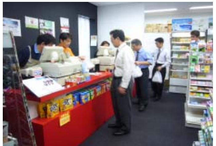
「お買い上げありがとうございました...」

特に新入社員研修では社会人としての入口に当たって、当社で働く障がい者の社員と半年間共に過ごす機会があります。設立以来17年間にわたり毎年の新人が経験してきたことは、グループの社員にとって有形無形の財産であり、グループ全体の社風の形成に大いに役立ってきたと自負しています。今後も障がいを持つ方の職域の拡大に努め、「障がい者とともに、社員とともに、地域とともに、自然とともに」のコンセプトを実践していきたいと考えています。