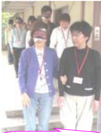
第1回 視覚障がい者のお話とガイドヘルプ体験

5月から2か月にわたりいろいろな体験を重ねた入門講座が、無事に終了しました。19名の受講生の方々からは、「こんな講座を探していた」「受けて良かった」「何か自分にもできると自信を持てた」とにかく行動してみる」など、たくさんの嬉しい声をいただきました。