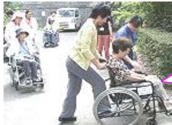
第3回 認知症高齢者への対応～地域のサポーターになるには