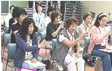
第2回 聴こえない方とのコミュニケーションの方法

受講生の皆さんは何事にも一生懸命で毎回多くの質問をいただき、ひとつひとつ疑問を解決しながら、確実にステップアップされていく姿は頼もしく感じました。講義、体験指導等でご協力をいただきました皆様に感謝いたします。