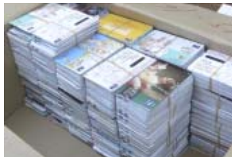
ボランティアセンターに届くたくさんの図書カード。ボランティアグループにより整理されています。

お客様のご協力なしにはできないことなので、啓文堂書店にご来店されるお客様を大切に、使用済み図書カードを通して地域貢献が継続できるように努力していきます。