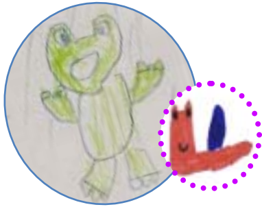
イラスト:和田中5組(特別支援学級) の生徒さん 作