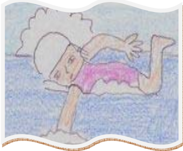
イラスト:和田中5組(特別支援学級)の生徒さん 作