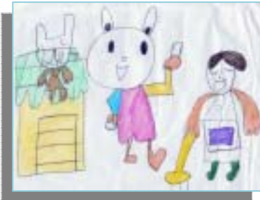
イラスト：和田中5組 (特別支援学級)の生徒さん 作