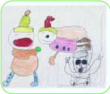
イラスト：和田中5組 (特別支援学級)の生徒さん 作