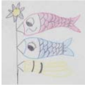
イラスト：和田中5組 (特別支援学級)の生徒さん 作