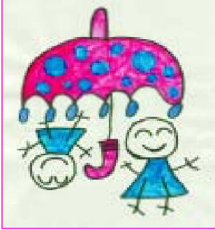
イラスト：和田中5組 (特別支援学級)の生徒さん 作