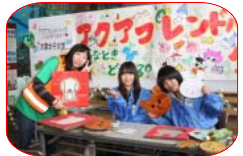
楽しい企画が満載ですよ！！

詳細は、ホームページやボランティア通信2月号等をご覧ください。どうか、ボランティアセンターまでお問い合わせください。